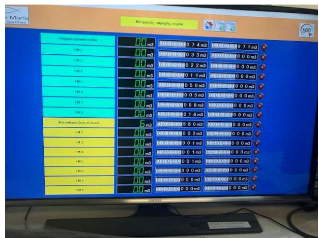
Description: Water supplier recorders