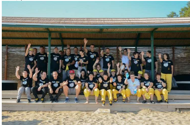
Description: Montly Cleaning of the Beach by Hotel Staff & guests