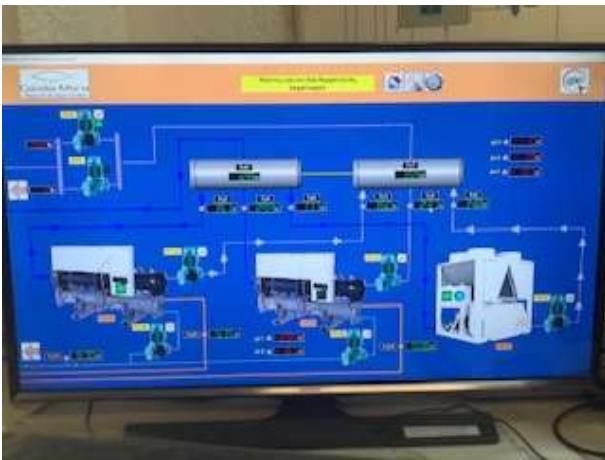
Description : Clima & Heating Operational Recorders