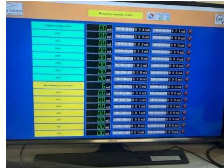
Περιγραφή/Description: Καταγραφές παροχής νερού / Water supplier Recorders