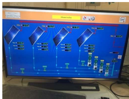
Περιγραφή/Description :Μετρητές Ηλιακού Πεδίου/ Solar Panels measurements