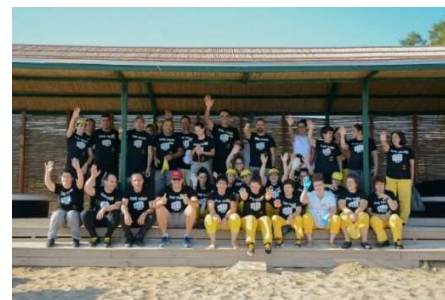
Περιγραφή/Description: Μηνιαίος Καθαρισμός Παραλίας από εργαζόμενους και πελάτες